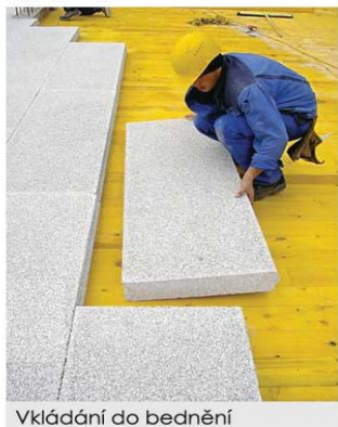
Vkládání do bedně

Vlastnosti 3i-izolačních desek zaručují trvalé spojení s betonem, takže není nutné žádné další mechanické kotvení.