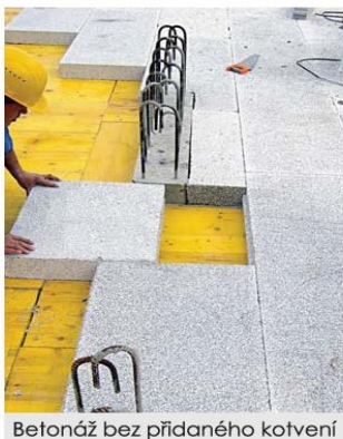
Betonáž bez přidaného kotvení