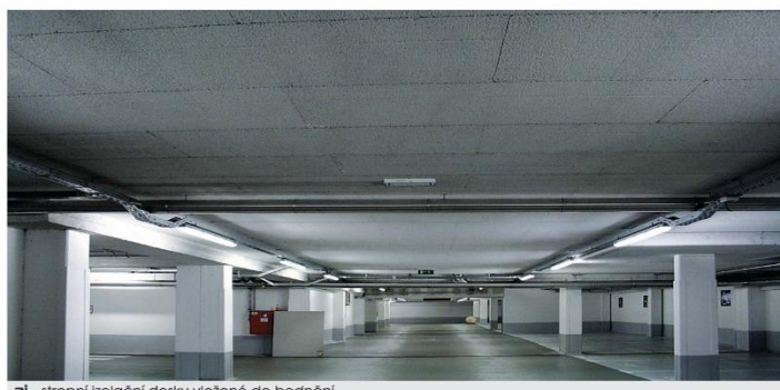
3i - stropní izolační desky vložené do bedně